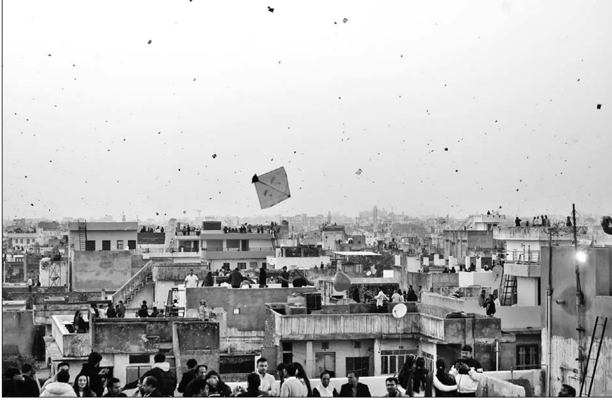
जयपुर में मकर संक्रांति पर्व पर मंगलवार को सुबह से ही लोग छतों पर डटे रहे और पतंगबाजी का आनंद लिया।