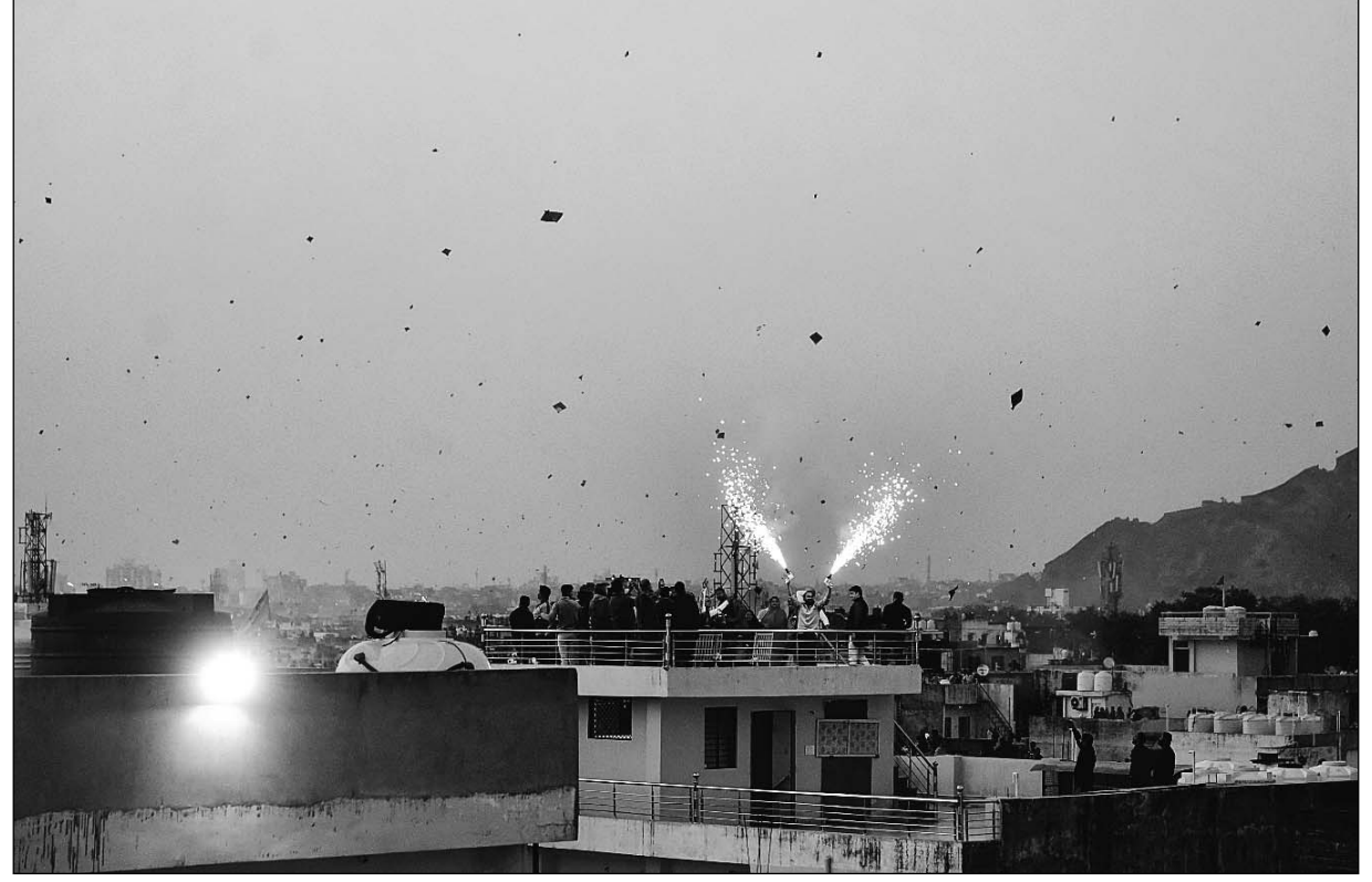
शाम होते ही लोगों ने आतिशबाजी कर पतंगबाजी का आनंद लिया।