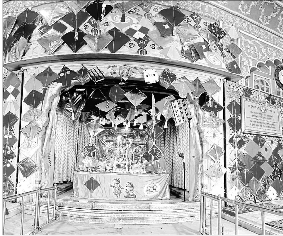
मकर संक्रांति पर गाविंददेवजी मंदिर में भगवान ने पतंग उड़ाई।