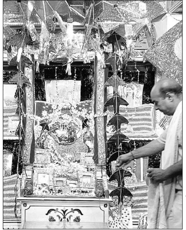
सरस निकुंज मंदिर में सजाई भगवान की भव्य झांकी।

जयपुर। माघ कृष्ण प्रतिपदा मंगलवार को मकर संक्रांति पर्व धूमधाम से मनाया गया।