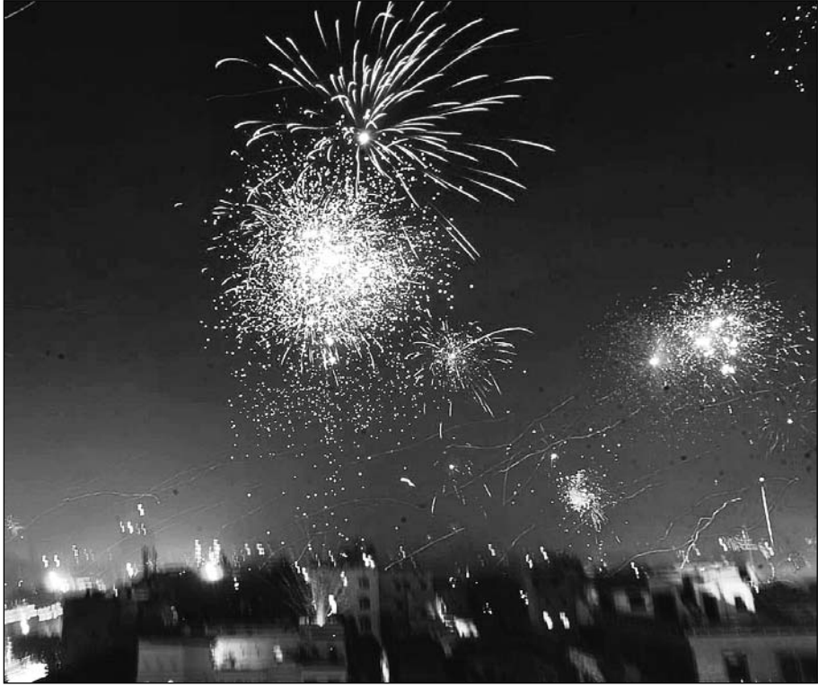
जयपुर में मंगलवार को रात्रि में आतिशबाजी का दृश्य।