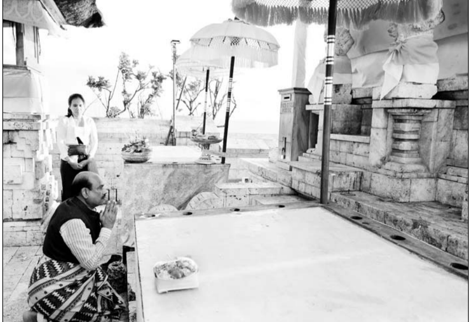
लोकसभा अध्यक्ष ओम बिरला ने बुधवार को बाली, इंडोनेशिया के उलुवातु मंदिर में पूजा अर्चना की।

उसके बाद प्रतिनिधिमंडल बाली के विश्व प्रसिद्ध उलुवातु मंदिर पहुंचा। यह मंदिर बाली के नौ प्रमुख डायरेक्शनल मंदिरों में से एक है। अद्भुत वास्तुकला से सुसज्जित, यह मंदिर एक अद्वितीय स्थान पर स्थित है जहां ऊपर बने बादल हैं और नीचे चट्टानों पर लहरें आकर टकराती हैं। बाद में, बिरला ने उलुवातु केकड डांस ओपन थिएटर, बाली में केकड नृत्य प्रदर्शन देखा। चूंकि यह नृत्य रामायण से प्रेरित है, इसलिए इससे विशेष रूप से भारतीय मूल के लोगों में गर्व की भावना उत्पन्न होती है कि भारत की समृद्ध संस्कृति इतने दूर-दूर तक के क्षेत्रों तक भी फैली हुई है।