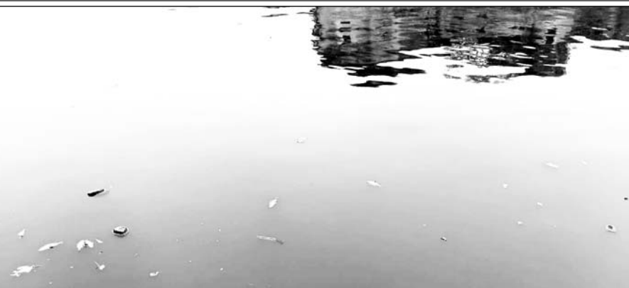
सुजानगंगा नहर के पानी में मरी हुई मछलियां।

सुजानगंगा नहर में अब से कुछ वर्ष पूर्व भी पानी में मछलियों के मरने की घटना सामने आई थी। तब हजारों मछलियों की मौत हो गई थी। जिसका कारण पानी में ऑक्सीजन की कमी बताया गया था। एक बार फिर से पानी में मछलियों के मरने की घटना सामने आ रही है। नगर निगम के द्वारा पानी में भरकट ऊपर आ रही मछलियों की सफाई का कार्य भी शुरू