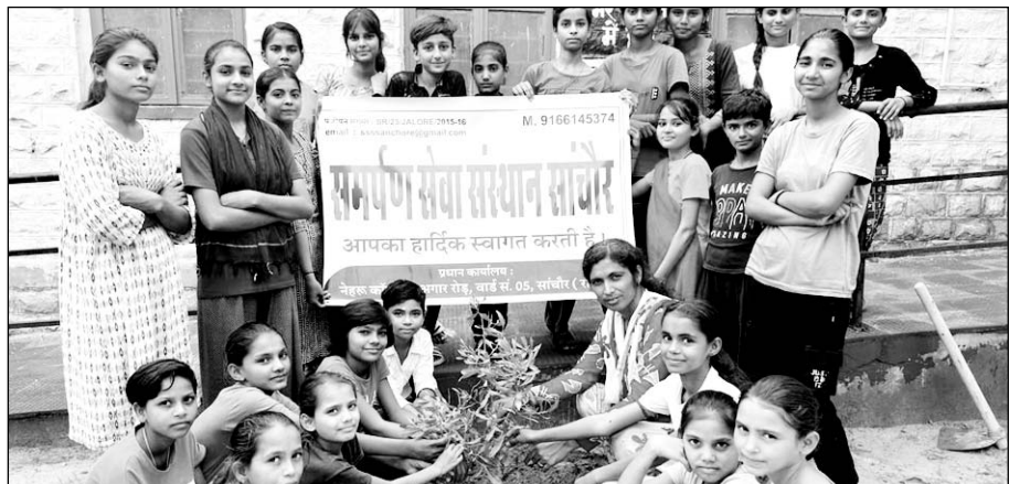
जालोर के राजकीय देवनारायण बालिका छात्रावास में पौधारोपण किया।

जालोर, (कासं)। सर्पण सेवा संस्थान सांचोर के संयुक्त तत्वाधान में राजकीय देवनारायण आदर्श बालिका छात्रावास जालोर में एक पेड़ में नाम अभियान की शुरुआत देश के प्रधानमंत्री नरेन्द्र मोदी एवं राजस्थान