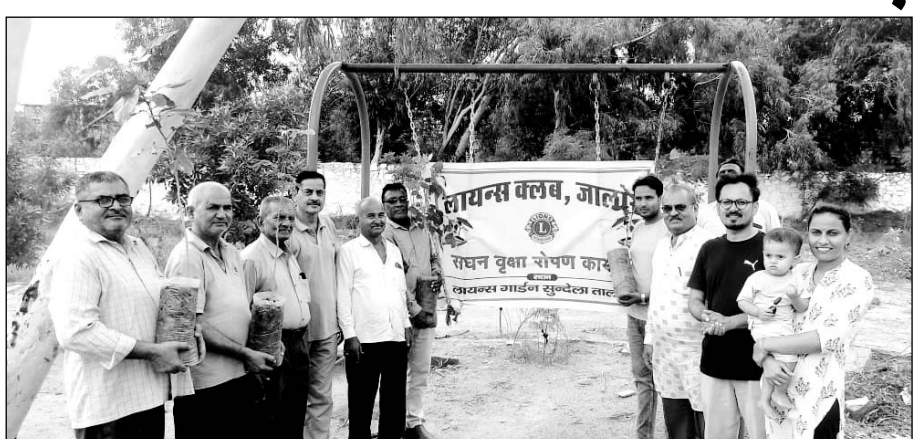
जालोर में लायंस क्लब पदाधिकारियों ने पौधारोपण किया।

जालोर, (कासं)। जालोर शहर के नेहरू उद्यान में लायंस क्लब पदाधिकारियों ने पर्यावरण संरक्षण को मुहिय के तहत सुंदेदाव तालाब के पास स्थित लायंस क्लब उद्यान में सोमवार