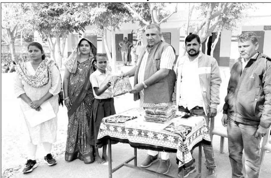
राजकीय प्राथमिक विद्यालय सुजाननाड़ी लेटा में कक्षा एक से पांचवी तक के विद्यार्थियों को भामाशाह परिवार ने स्वेटर वितरण किया।