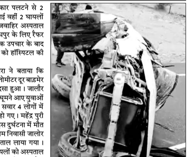
कार हादसे के बाद चकनाचूर हो गई।

जैसलमेर, (निसं)। जैसलमेर में कार पलटने से 2 लोगों की घटनास्थल पर ही मौत हो गई वहीं 2 घायलों को जवाहिर अस्पताल लाया गया। जवाहिर अस्पताल में गंभीर हालत में एक युवक को जोधपुर के लिए रेफर कर दिया वहीं एक युवक को प्राथमिक उपचार के बाद छुट्टी दे दी गई। दोनों मृतकों के शवों को हॉस्पिटल की मोर्चरी में रखवाया गया है।