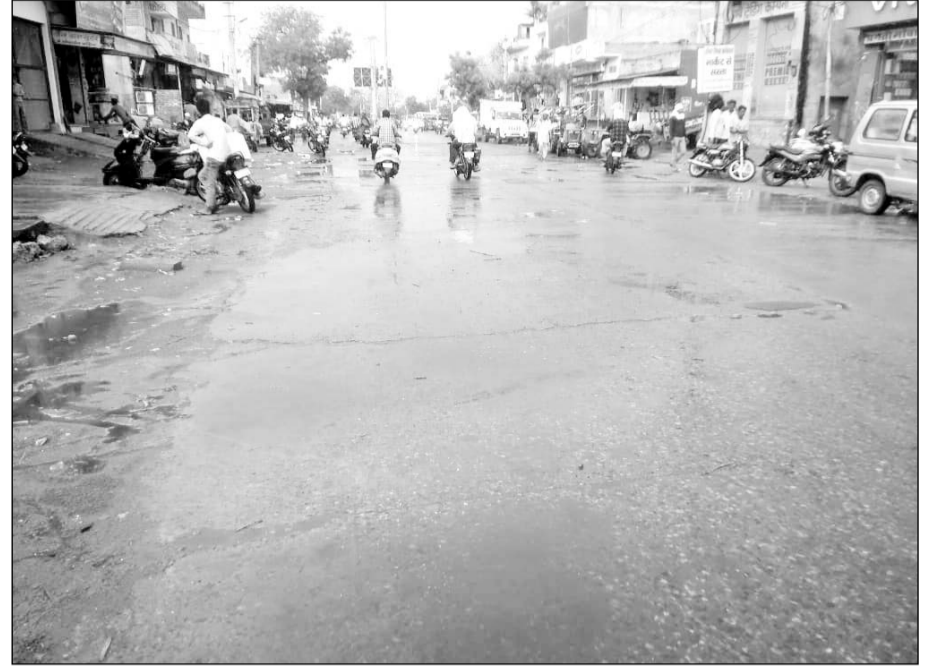
निवाड़ में बरसात होने के बाद सड़कों पर पानी भर गया।

एक माह से तापमान 45 से 46 डिग्री सेल्सियस पर चल रहा है