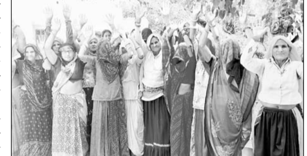
ढाकपुरी पंचायत समिति के पीला ढावा के ग्रामीणों प्रदर्शन किया।

अलवर ग्रामीण विधानसभा की ढाकपुरी पंचायत समिति के पीला ढावा ग्रामीणों ने प्रदर्शन कर आरोप लगाया है कि इस योजना को पूरा कर दिया गया है लेकिन यहां पेयजल सप्लाई नहीं हो पा रही है जिस कारण लोगों को पेयजल के लिए भटकना पड़ रहा है। ग्रामीणों का आरोप है कि योजना के तहत बनी टंकी में दरारें हैं जिस कारण इसे भरा नहीं जा रहा है, घटिया पाइप डाले गए हैं। यही नहीं यहां लगे बोरिंग ने भी एक साल में ही पानी उठाना बंद कर दिया है क्योंकि यह बोर उचित गहराई तक नहीं किए गये हैं और इमें मीलों लगी टंकी भी कम पावर की है। ग्रामीणों ने ठेकेदार