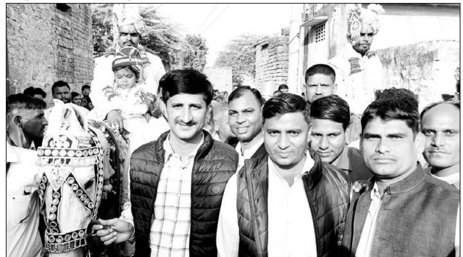
पंचायत कैरोडी में निकासी निकालते लोग।