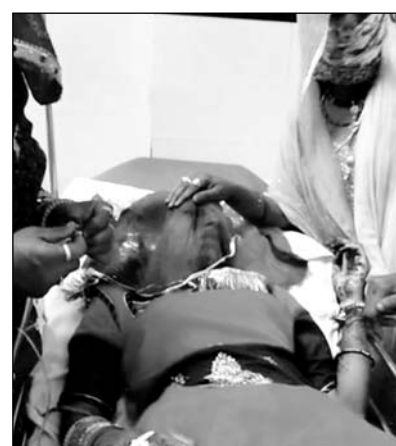
घायल दुल्हन का अस्पताल में उपचार किया।