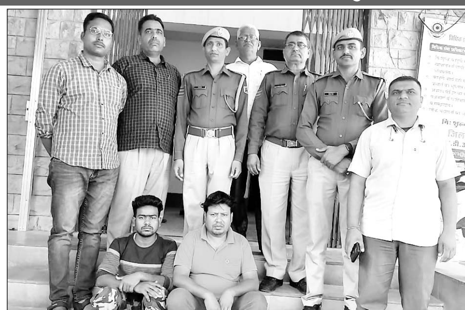
बाड़मेर में कोतवाली पुलिस ने सोना चोरी के मामले में दो आरोपियों को गिरफ्तार किया।