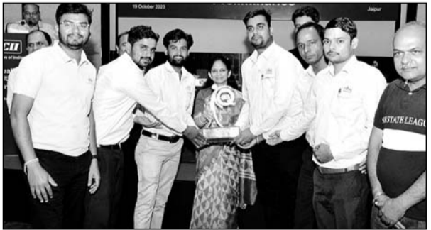
भारतीय उद्योग परिसंघ के पदाधिकारियों ने 36 वीं क्वालिटी सर्कल प्रतियोगिता के समापन समारोह में मुख्य अतिथि परिवहन आयुक्त डॉ. मनीषा अरोड़ा का स्वागत किया।