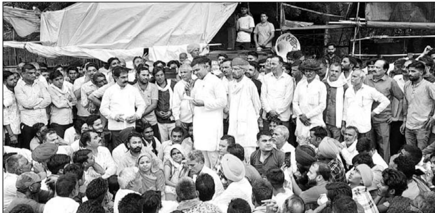
खेल राज्यमंत्री अशोक चांदना अपनी ही सरकार के खिलाफ कलेक्ट्रेट के बाहर धरने पर बैठ गए।

गौरतलब है कि गत सोमवार को राज्यमंत्री अशोक चांदना ने हिण्डोली-नैनवां विधानसभा क्षेत्र में बिजली और सिंचाई के पानी की समस्याओं को