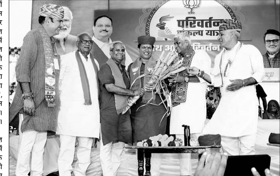
जालोर के निकट बिशनगढ़ में भाजपा की परिवर्तन संकल्प यात्रा के पहुंचने पर केंद्रीय जलशक्ति मंत्री गर्जेन्द्रसिंह के केंद्रीय कृषि राज्य मंत्री कैलाश चौधरी का स्वागत किया।

केंद्रीय राज्य कृषि मंत्री कैलाश चौधरी ने कहा कि कांग्रेस सरकार में कानून व्यवस्था की बदहाल स्थिति के कारण आज राजस्थान में आमजन ही सुरक्षित नहीं है। उन्होंने कहा कि कांग्रेस सरकार का तो गठन ही विग्रह के साथ हुआ था। जब इस सरकार के शपथ ग्रहण के दिन दो-दो मुख्यमंत्रियों के नारे लगे थे। राजस्थान के इतिहास में यह पहली बार हुआ जब पूरी सरकार ही 52 दिनों