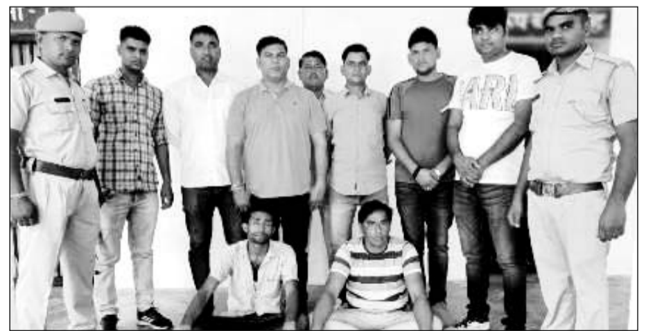
जिला स्पेशल टीम और कुड़गांव थाना पुलिस ने अवैध स्मैक के साथ दो आरोपियों को गिरफ्तार किया।