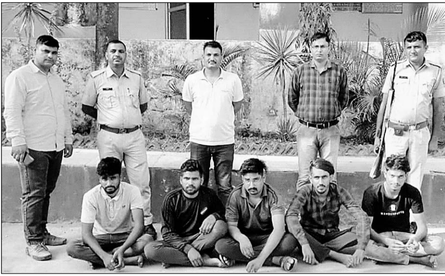
राजसमंद : मजारों की तोड़फोड़ करने के मामले में पुलिस ने पांच जनों को गिरफ्तार किया।