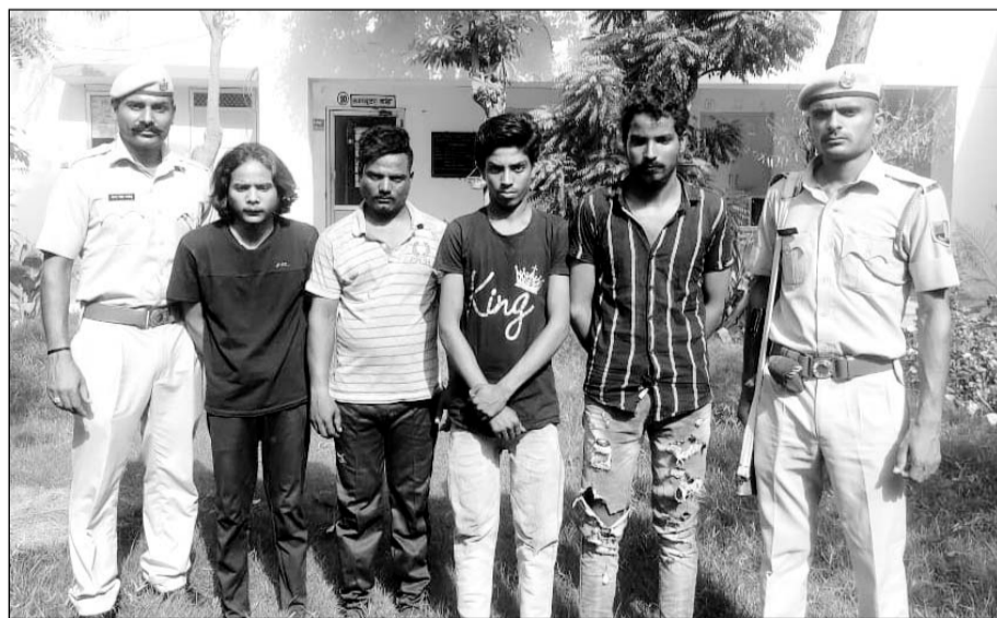
सुभाषनगर थाना पुलिस ने हिस्ट्रीशीटर की हत्या की साजिश रचते एक अन्य हिस्ट्रीशीटर सहित चार युवकों को गिरफ्तार कर चाकू सहित अन्य हथियार बरामद किए।