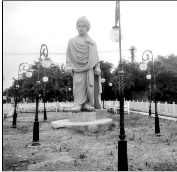
विवेकानंद सर्किल पर उगी झाड़ियां व टूटी पड़ी कुर्सियां।

फिर भी नगर पालिका प्रशासन तथा उच्चाधिकारियों बेपरवाह बनकर बैठे हुए हैं। जिसके कारण आज यह सर्किल दिनों दिन उपेक्षा का भी शिकार बनता जा रहा है। जानकार सूत्रों के अनुसार उपखंड कार्यालय के सामने लाखों रूप्ये खर्च कर विवेकानंद सर्किल का निर्माण किया गया जिसमें आमजन के लिए कई सुविधाएं भी उपलब्ध करवाई गईं। लेकिन प्रशासन द्वारा समयानुसार ध्यान नहीं देने के कारण वहां की स्थिति बदहाल हो रही है। देखरेख के अभाव में इसके अंदर लगी कुर्सियां टूट चुकी हैं और चारों तरफ बम्यूल सहित कई गंदगी के ढेर लगे हुए हैं। वहीं बिजली