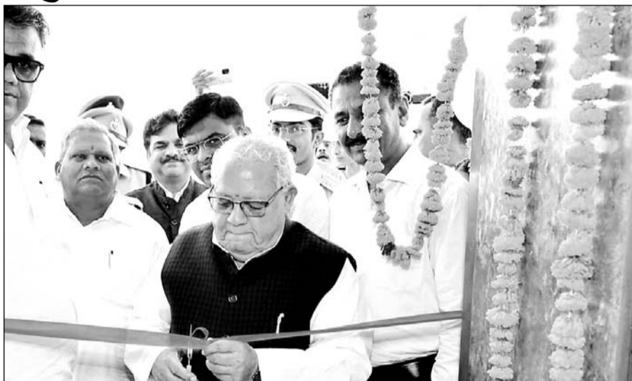
माउंट आबू में गोविंद गुरु पुस्तकालय का लोकार्पण राज्यपाल कलराज मिश्र ने किया।

जालोर/माउंट आबू, (कासं)। राज्यपाल कलराज मिश्र ने सोमवार को आबूरोड में नगर सुधार न्यास आबू द्वारा विकसित गोविंद गुरु पुस्तकालय का लोकार्पण किया।