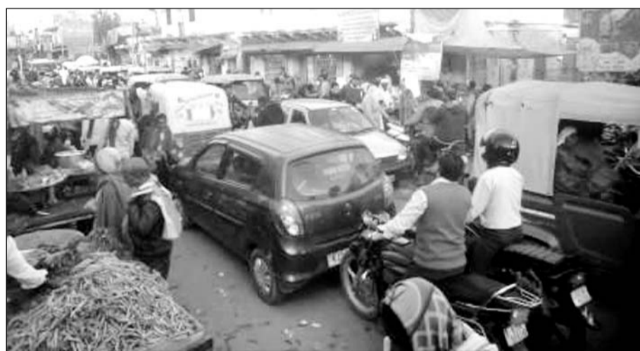
करौली में कोतवाली थाने के बाहर बिगड़ी यातायात व्यवस्था के चलते सड़क पर लगा वाहनों का जाम।

बाग का मार्ग जिस समय गौरव पथ के रूप में विकसित किया गया था उस दौरान नगर परिषद की ओर से मार्ग को पूरी तरह नोन वैंडिंग जोन घोषित कर दिया इसके बावजूद इस मार्ग पर फल, सब्जियों के ठेले वालों ने कब्जा जमा रखा है और प्रभावशाली लोग अपनी दुकान और घरों के आगे सब्जियों के ठेले लगाने की एवज में उनसे मासिक रूप से भी वसूल करते हैं। यह मामला नगर परिषद के नगर