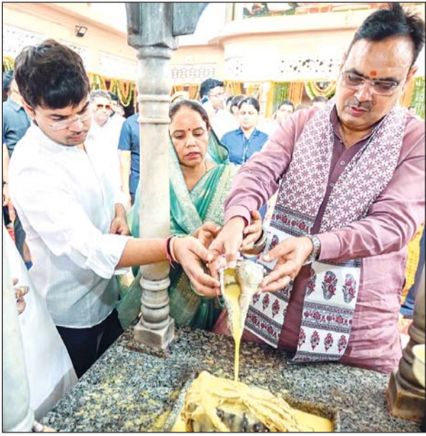
मुख्यमंत्री भजनलाल शर्मा ने मंगलवार को गिरिराज धरण की परिक्रमा संपन्न की और डीग में पंचोत्री का लौटा स्थित श्रीनाथ जी के दर्शन किए।

इसके पश्चात, मुख्यमंत्री ने श्रीनाथ जी मंदिर परिसर में उपस्थित संतों, स्थानीय नागरिकों और दूर-दराज से आए श्रद्धालुओं को अपने हाथों से प्रसादी वितरित की। उन्होंने इस दौरान श्रद्धालुओं से आत्मीय संवाद कर यात्रा के दौरान मिल रही सुविधाओं के संबंध में जानकारी ली। उल्लेखनीय है कि मुख्यमंत्री ने सोमवार शाम को सप्तकोसी परिक्रमा प्रारंभ की थी, जो