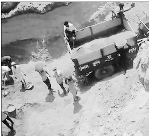
अलवर थाना उद्योग नगर क्षेत्र में अवैध बजरी खनन करते लोगों।

अवैध बजरी खनन से परेशान किसानों ने पुलिस कंट्रोल रूम जयपुर व पुलिस कंट्रोल रूम अलवर को माफिया की शिकायत की। किसानों ने बताया कि एम आई ए थाना उद्योग नगर क्षेत्र के गांव केसरोली किला से 1 किलोमीटर दूरी पर जोगी का नगला के आस-पास व बगड़ राजपूत क्षेत्र में अवैध बजरी खनन जोरों पर है। किसानों ने बताया कि उपजाऊ जमीन के आस-पास लगभग 20-30 फीट गहरे गड्ढे कर दिए हैं। माफिया ने विरोध कर रहे किसानों को धमकाया