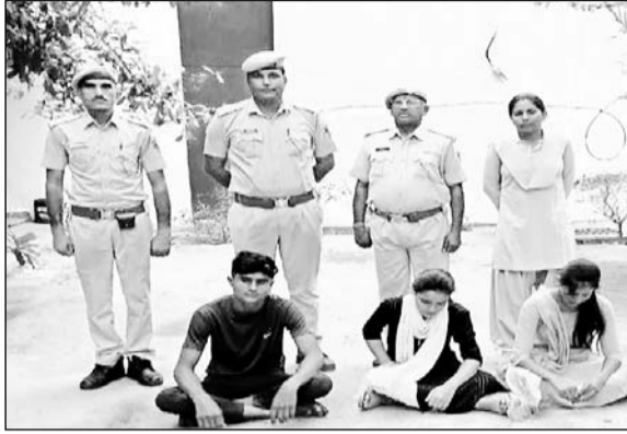
जालोर जिले की आहोर पुलिस ने कूट रचित दस्तावेज तैयार कर फर्जी रूप से परीक्षा देने वाले तीन लोगों को गिरफ्तार किया।