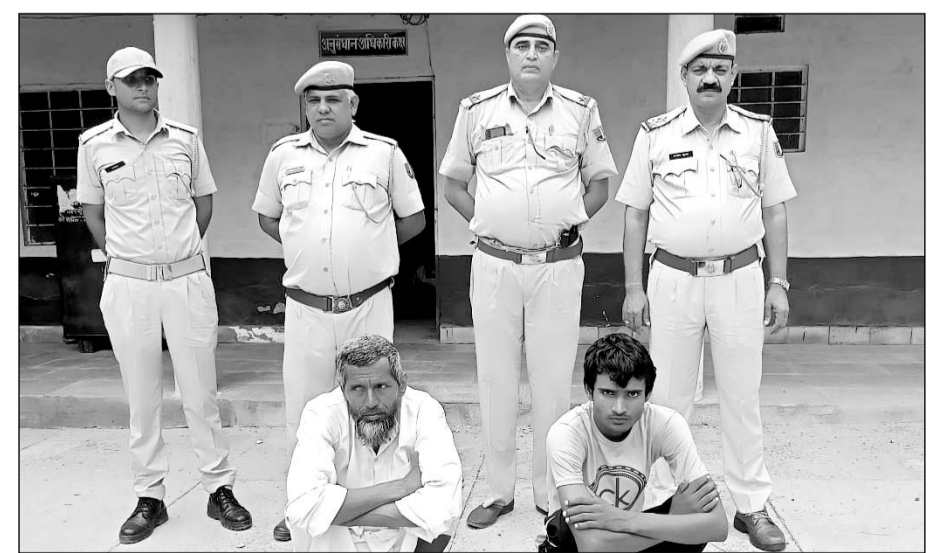
मुखबिर की सूचना पर जुरहरा थाना पुलिस ने आरोपियों को गिरफ्तार किया।

जुरहरा, (निर्स)। स्थानीय थाना पुलिस ने मुखबिर की सूचना के आधार पर कार्रवाई करते हुए हत्या के मामले में वांछित दो आरोपियों को गिरफ्तार किया है। जुरहरा थाना अधिकारी संतोष