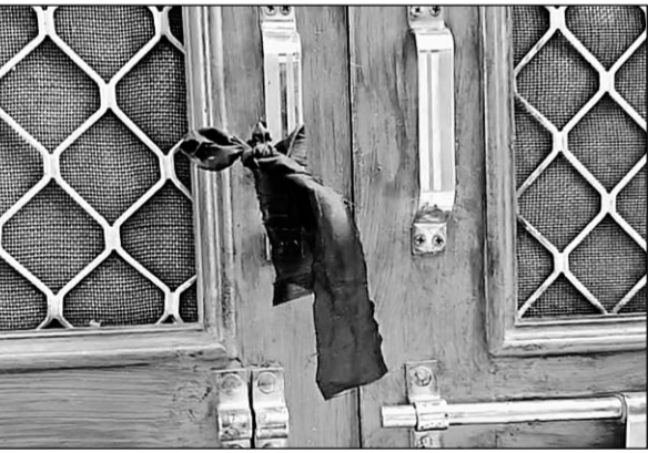
हिंदू समाज के लोगों ने घरों के बाहर विरोधस्वरूप काली पट्टियां बांधी

जानकारी के अनुसार उपनगर सांगानेर में दो दिन पहले गणेश पंडाल पर कुछ लोगों ने पथराव किया, जिससे माहौल गरमा गया था। बीती रात को भी सकल हिंदू समाज के लोगों ने कार्यवाही और कुछ मार्गों को लेकर पुलिस चौकी का घेरा किया, देर रात तक कोई समझौता नहीं हो पाया और सकल हिंदू समाज ने फैसला किया कि वह दूसरे पक्ष के त्योंहार को नहीं देखेंगे। इसी के चलते सोमवार सुबह काली मंगरी चले गए, जहां वह भजन कीर्तन कर रहे हैं और सामूहिक भोज का आयोजन किया