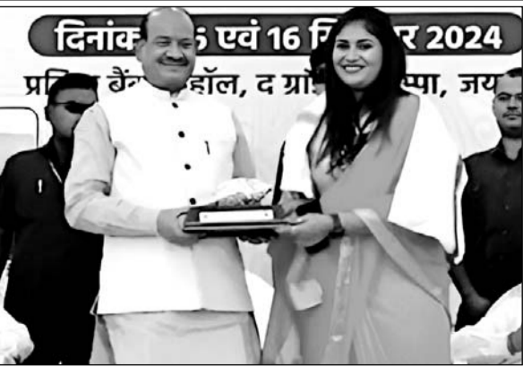
राजसमंद में आयोजित कार्यशाला में लोकसभा अध्यक्ष ओम बिरला, विधायक दीप्ति माहेश्वरी आदि मौजूद रहे।

उन्होंने कार्यशाला की सराहना करते हुए कहा कि राष्ट्रीय वैश्य महासम्मेलन विकसित भारत की संकल्पना को साकार करने के लिए समाज में सजगता और एकता लाने का महत्वपूर्ण कार्य कर रहा है। कार्यशाला के मुख्य वक्ता लोकसभा अध्यक्ष ओम बिरला ने भी इस बात पर जोर दिया कि राजनीति और समाज में हमें जाति के आधार पर नहीं बल्कि हमारे कार्यों और समाज में योगदान के आधार पर अपना