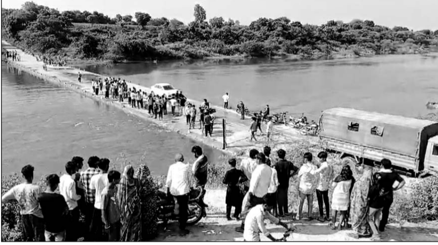
मांडलगढ़ में बीगोद के पास बनास नदी में बहे मां-बेटे के शव 21 घण्टे बाद मिले।