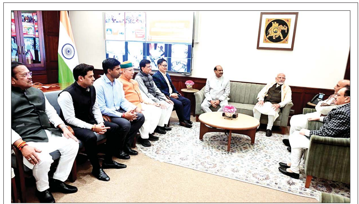
शीतकालीन सत्र के समापन के बाद प्रधानमंत्री नरेंद्र मोदी, रक्षा मंत्री राजनाथ सिंह, संसदीय कार्य मंत्री किरेन रिजिजू व अन्य दलों के नेताओं ने लोकसभा चैम्बर में मुलाकात की।

दिवस के अवसर पर प्रदेश भर में विभिन्न कार्यक्रमों का आयोजन किया जाएगा। वहीं 26 दिसंबर को देशभर में "वीर बाल दिवस" मनाया जाएगा। वीर बाल दिवस पर सिख गुरु गोविंद सिंह के पुत्र साहिबजादों बाबा जोरावर सिंह और बाबा फतेह सिंह जी की शहादत की स्मृति में प्रदेशभर में विभिन्न कार्यक्रमों का आयोजन किया जाएगा। विपक्ष मनु स्मृति की चर्चा कर रहा है, जबकि आसन द्वारा मांगने पर मना कर दिया गया और कहा गया कि एक ही काँपी है। जब जो समाज में है ही नहीं, उसकी चर्चा क्यों की जा रही है। अगर आप मनु स्मृति की बात करते हो तो सरिया कानून की बात भी करो, जिसका कि आप खुलकर समर्थन करते हो। लेकिन ये उस पर चर्चा नहीं करेंगे। संविधान में जिसकी कोई व्यवस्था नहीं है उसकी चर्चा करके समाज को भ्रमित नहीं करना चाहिए।