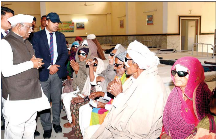
राज्यपाल हरिभाऊ बागडे ने सोमवार को गांव पदमपुरा बाड़ा में श्री कौशलया चैरिटेबल ट्रस्ट द्वारा आयोजित मेगा नेत्र चिकित्सा शिविर का अवलोकन कर वहां भती मरीजों से संवाद किया।

जयपुर। राज्यपाल हरिभाऊ बागडे ने सोमवार को गांव पदमपुरा बाड़ा में श्री कौशलया चैरिटेबल ट्रस्ट द्वारा आयोजित मेगा नेत्र चिकित्सा शिविर का अवलोकन कर वहां भती मरीजों से संवाद किया। केंद्र और राज्य सरकार द्वारा गरीब, पिछड़ों के लिए चलाई जा रही योजनाओं के बारे में जानकारी भी ली। उन्होंने इस दौरान कहा कि परोपकार ही सबसे बड़ा धर्म है। चिकित्सा से जुड़ा सेवा कार्य ही ईश्वर की आराधना है। उन्होंने वहां पर नेत्र चिकित्सा से लाभान्वित काश्तकारों, श्रमिकों की बेहतर और निःशुल्क चिकित्सा व्यवस्था की सराहना की।