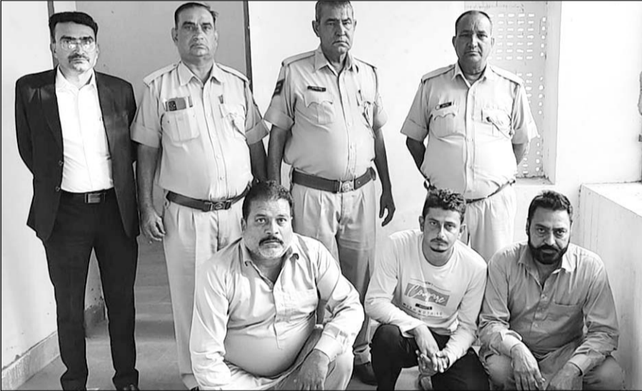
डोडा-पोस्ट तस्कारी मामले में आरोपियों को कोर्ट ने सजा सुनाई।

सादुलपुर, (निर्स)। अपर जिला सेशन न्यायाधीश क्रम सं.-2 राजगढ़ ने लगभग साढ़े नौ वर्ष पुराने डोडा-पोस्ट चूरा तस्कारी मामले में तीन आरोपियों को 7-7 साल कठोर कारावास की सजा से दंडित किया है।