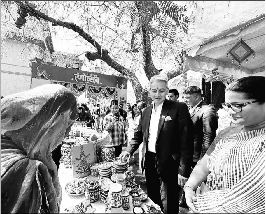
जयपुर शासन सचिवालय में मंगलवार को मुख्य सचिव सुधांशु पंत ने राजीविका रंगोत्सव-2025 का शुभारंभ किया। इसके बाद उन्होंने शर्बत स्टॉल, बगरू ग्रिन्ट दुपट्टा, कशीदाकारी बैग, बाजरा कुकीज आदि स्टॉलों से खरीददारी कर महिला उद्यमियों का उत्साह बढ़ाया।

जयपुर। शासन सचिवालय में मंगलवार को मुख्य सचिव सुधांशु पंत द्वारा राजीविका रंगोत्सव-2025 का शुभारंभ किया गया। यह आयोजन शासन सचिवालय में 4 मार्च से 7 मार्च तक आयोजित किया जा रहा है, जिसमें राजीविका से जुड़ी स्वयं सहायता समूह की महिलाओं के उद्यमशीलता को सफलता को प्रदर्शित किया जायेगा। मुख्य सचिव ने शर्बत स्टॉल, बगरू ग्रिन्ट दुपट्टा, कशीदाकारी बैग, बाजरा कुकीज आदि स्टॉलों से खरीददारी कर महिला उद्यमियों का उत्साह बढ़ाया। स्वयं सहायता समूह की महिलाओं से बातचीत की और आत्मनिर्भरता की दिशा में उनके प्रयासों की सराहना की। उन्होंने राजसमंद व जोधपुर जिलों में शर्बत व बाजरा आधारित उत्पादों की विक्री की सराहना की। राजीविका रंगोत्सव में