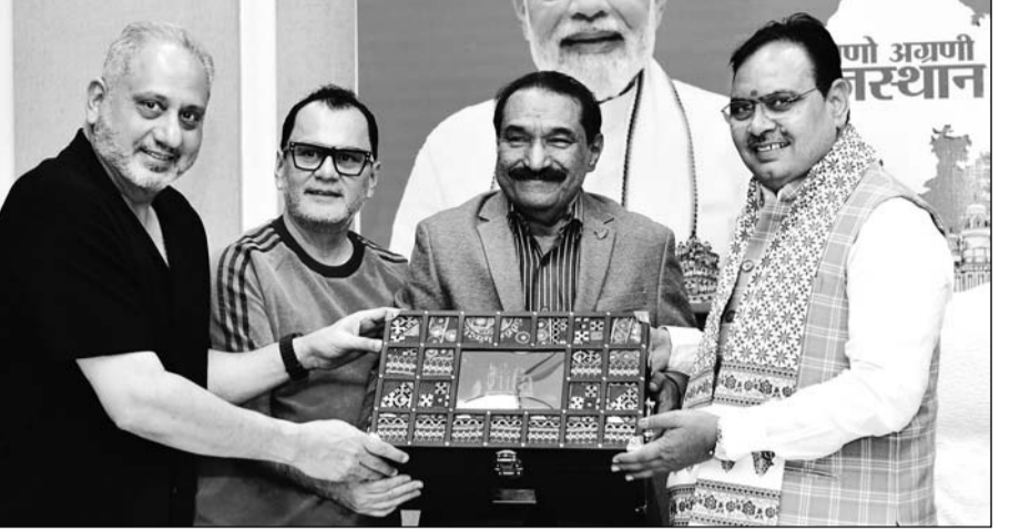
आईफा अवार्ड्स आयोजन समिति के सदस्यों ने मुख्यमंत्री भजनलाल शर्मा से मंगलवार को उनके निवास पर मुलाकात की।

जयपुर। मुख्यमंत्री भजनलाल शर्मा से मंगलवार को आईफा अवार्ड्स आयोजन समिति के सदस्यों ने मुख्यमंत्री निवास पर मुलाकात कर आईफा अवार्ड्स समारोह में शामिल होने का निमंत्रण दिया। समिति सदस्यों ने 8 एवं 9 मार्च को राजधानी जयपुर में आयोजित होने वाले समारोह सहित विभिन्न कार्यक्रमों की विस्तृत जानकारी