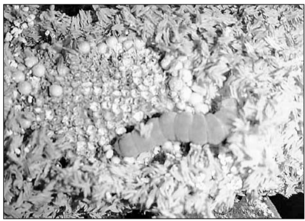
लूणा क्षेत्र में बाजरे की फसल में लगी लट।

सांभरझील, (निर्स)। लूणा क्षेत्र के आस-पास के खेतों में इन दिनों कुदरत कहर बरफा रही है। लटों का प्रकोप बढ़ने से बाजरे की फसल खराब होने के कगार पर है।