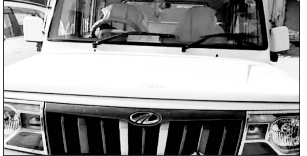
जयपुर की टीम ने तम्बाकू, सुपारी थोक विक्रेता के यहां छापामारी कार्रवाई की

हिण्डौन सिटी (कासं)। शहर में जीएसटी विभाग, जयपुर की टीम ने बुधवार को एक शहर के एक तम्बाकू, सुपारी उत्पाद के थोक विक्रेता कारोबार के प्रतिष्ठान पर छापामारी कार्रवाई की। विभाग की टीम ने सुबह 7 बजे से चली कार्रवाई में टीम के सदस्यों ने बयाना रोड स्थित टीकम कटरा स्थित