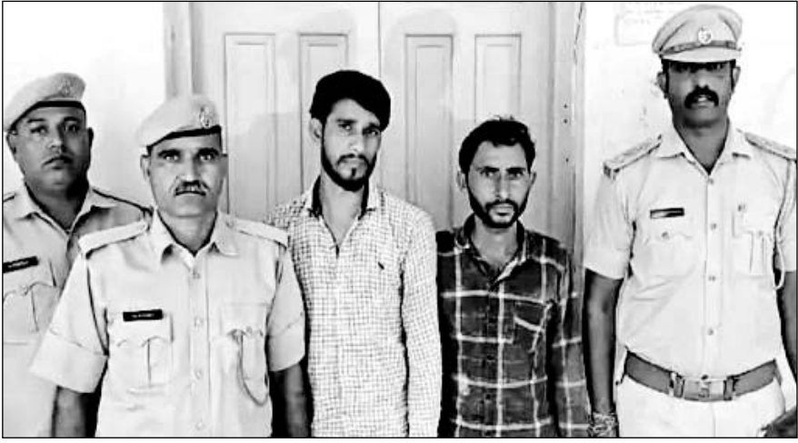
सरिस्का के बफर ज़ोन में करंट लगाकर शिकार करने वाले दो शिकारियों को गिरफ्तार किया।