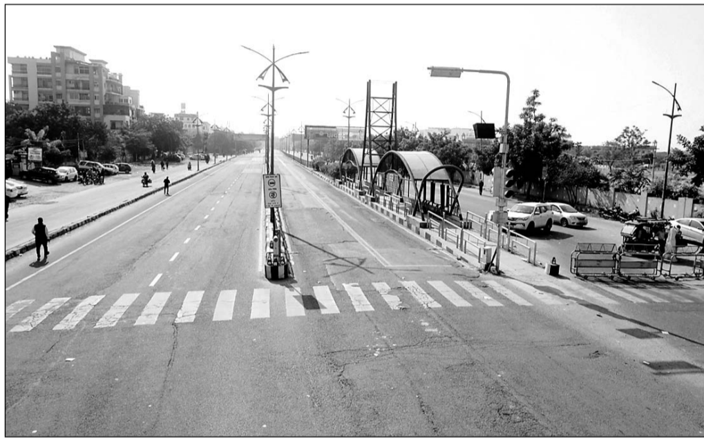
'राजस्थान बंद' के कारण जयपुर-सीकर रोड पर भवानी निकेतन कॉलेज के बाहर दिनभर मुख्य सड़क पर सन्नाटा पसरा रहा, ऐसा लगा जैसे राजधानी जयपुर में कर्फ्यू लगा हुआ हो।