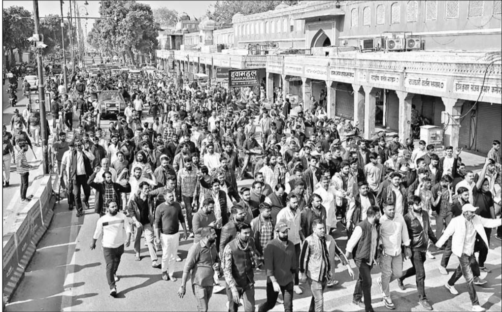
जयपुर में राजपूत समाज के युवाओं का रैला सड़कों पर उतरा।

जयपुर। श्री राष्ट्रीय राजपूत करणी सेना के राष्ट्रीय अध्यक्ष सुखदेव सिंह गोगामेड़ी की हत्या से सर्वसमाज स्तब्ध है। जिस तरह प्रदेश की राजधानी में घर में प्रवेश कर घटना को अंजाम दिया गया, वह न केवल दुर्भाग्यपूर्ण है बल्कि इस घटना की महाराव शेखा संस्थान घोर भर्त्सना करता है। समाज के सभी वर्गों, नौजवानों से प्रार्थना है कि अपनी भावनाओं को नियंत्रण में रखते हुए न्याय प्राप्त करने की अपील कानून के दायरे में रहते हुए करें। महाराव शेखा संस्थान राज्य सरकार से न्याय की मांग करते हुए स्वर्गीय सुखदेव सिंह के परिवार को सुरक्षा प्रदान करने, परिवार को तुरन्त राहत प्रदान करने हेतु पैकेज, परिवार को संरक्षण प्रदान करने के लिए सुखदेव सिंह के परिवार से किसी एक आश्रित को राजकीय सेवा में नियुक्ति प्रदान करने का आग्रह करता है। तथा हत्यारों के विरुद्ध सख्त कानूनी कार्यवाही करने की अपील करता है।