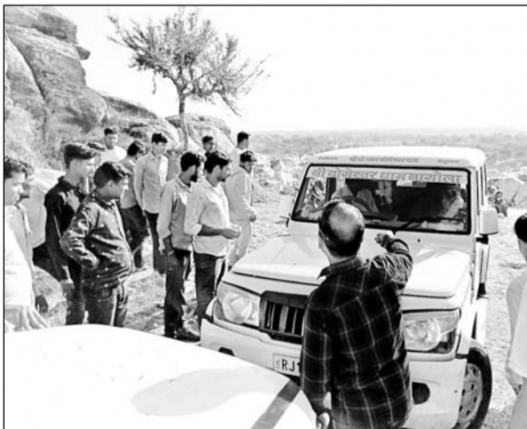
घटना स्थल पर लोगों की भीड़ जमा हो गई।