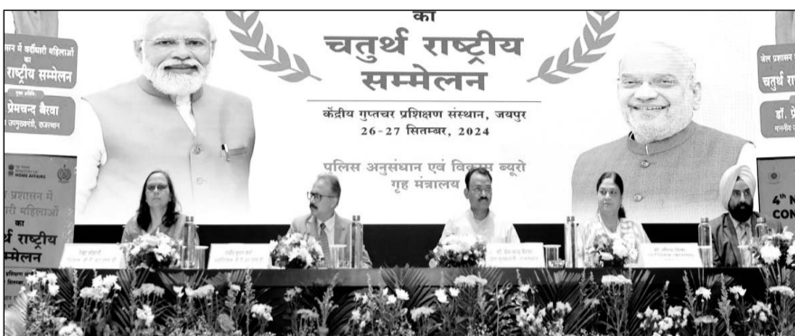
सीडीटीआई, जयपुर में जेल प्रशासन में वर्दीधारी महिलाओं के चतुर्थ राष्ट्रीय सम्मेलन का समापन समारोह प्रदेश के उपमुख्यमंत्री प्रेमचंद बैरवा के मुख्य आतिथ्य में हुआ।

इस सम्मेलन का शुभारंभ गृह राज्य मंत्री, भारत सरकार श्री बंडी संजय कुमार द्वारा गुरुवार को किया गया था। सम्मेलन का समापन समारोह सुक्रवार को प्रदेश के उपमुख्यमंत्री प्रेमचंद बैरवा के मुख्य आतिथ्य में हुआ। इस मौके पर बैरवा ने कहा कि सरकार का उद्देश्य जेल प्रशासन में महिलाओं की भागीदारी को और मजबूत करना है ताकि समग्र सुधारोत्तम प्रणाली