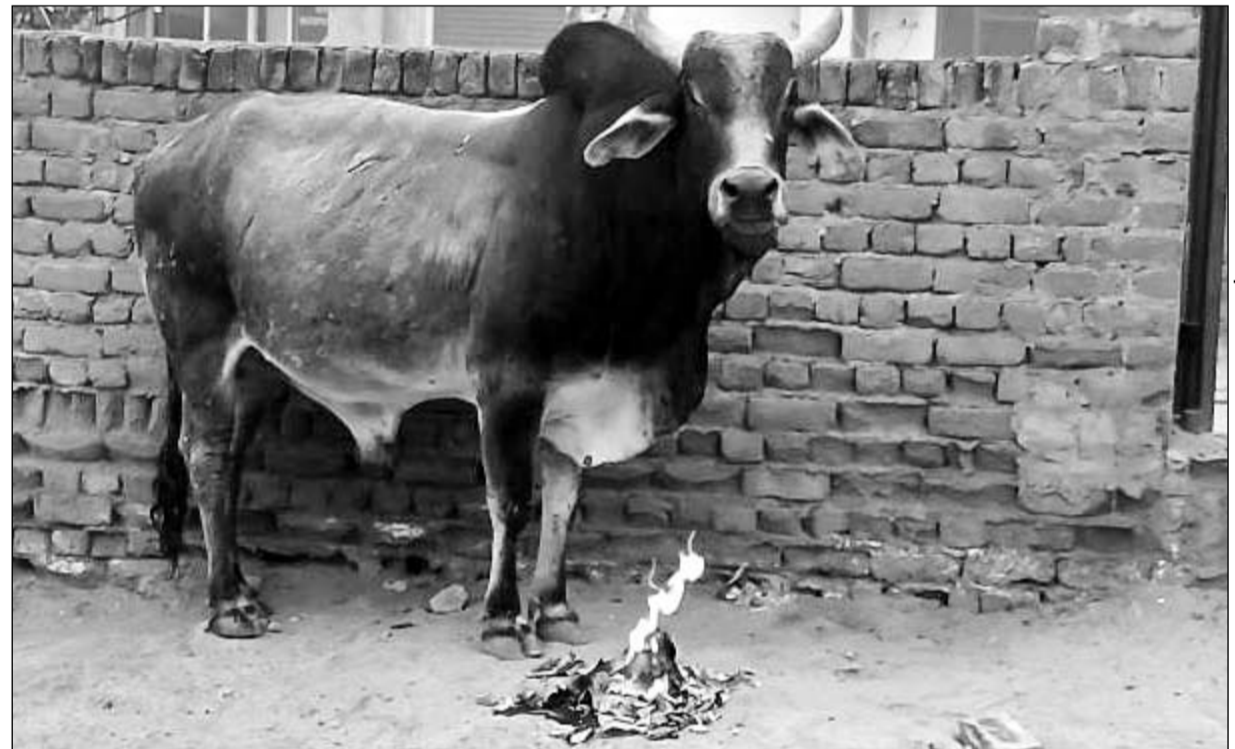
सादुलपुर क्षेत्र की वाल्मीकि बस्ती के पास अलाव के सहारे कड़ाके ठण्ड से राहत पाने का प्रयास करता सांड।

सादुलपुर, (कासं)। मंगलवार को सादुलपुर क्षेत्र घने कोहरे के चलते सफेद चादर की भांती नजर आया। वहीं बढते कोहरे से जहाँ किसान फसलों की बढवार को लेकर खुश नजर आये, वहीं दूसरी ओर घने कोहरे के कारण आमजन का जन-जीवन अस्त-व्यस्त नजर आया। वहीं पाला पडने की आशंका के चलते किसानों में मायूसी भी नजर आई। साथ ही एक सप्ताह से लगातार कोहरे ने सादुलपुर क्षेत्र को अपनी आगोस में ले रखा है। तो दूसरी तरफ सर्दी भी अपना रूढ़ रूप दिखा रही है। पिछले तीन-चार दिनों से पड़ रही कड़ाके की ठण्ड