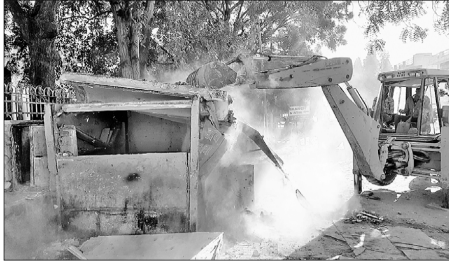
अजमेर विकास प्राधिकरण के दस्ते ने पुलिस लाइन के रास्ते पर बनी गुमटियों को हटाया।