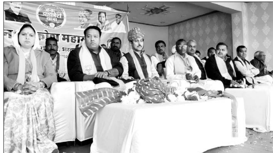
हलैना में जनक्रोश यात्रा के समापन समारोह में मौजूद भाजपा नेता।

उन्होंने कहा कि केंद्र सरकार ने राजस्थान सरकार को 27 हजार करोड़ रुपए हर घर नल द्वारा जल पहुंचाने के लिए दिए लेकिन अखंड भ्रष्टाचार में डूबी निकम्मी सरकार 4 साल में मात्र