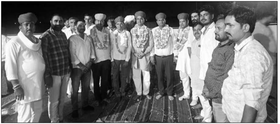
जालोर शहर में गंगा विहार कॉलोनी में लोगों ने भाजपा ओबीसी मोर्चा के प्रदेश उपाध्यक्ष ओबारा म देवासी का स्वागत किया।