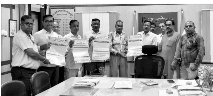
जालोर में हिन्दू सेवा समिति ने नगर परिक्रमा को लेकर संस्थाओं, समाजों तथा प्रशासनिक अधिकारियों को आमंत्रण पत्रिका देकर आमंत्रित किया।

भव्य मन्दिर दर्शन व नगर परिक्रमा शुरूवार को सुबह 6.30 बजे सूरजपोल स्थित गणपति मन्दिर से आरती के साथ प्रारम्भ होगा बच रास्ते के मन्दिर दर्शन के साथ रोडवेज डिपो स्थित माताजी मन्दिर, जागनाथ महादेव मन्दिर, कालिका मन्दिर, देवनारायण मन्दिर,