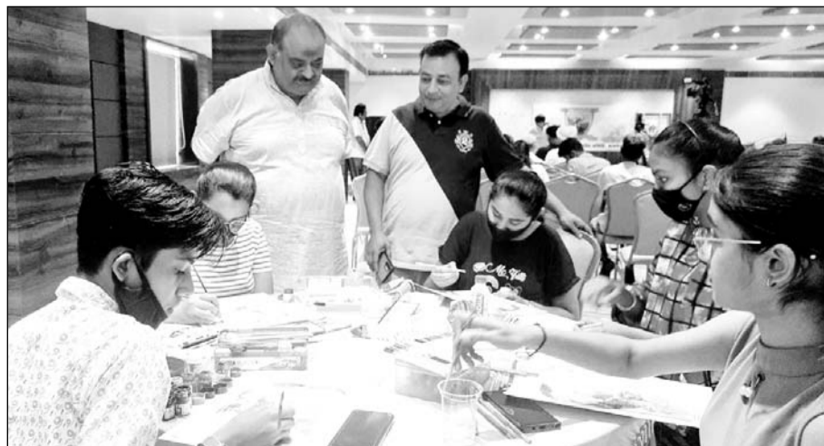
सम्राट पृथ्वीराज चौहान की जयन्ती पर चित्र भरो प्रतियोगिता आयोजित हुई।