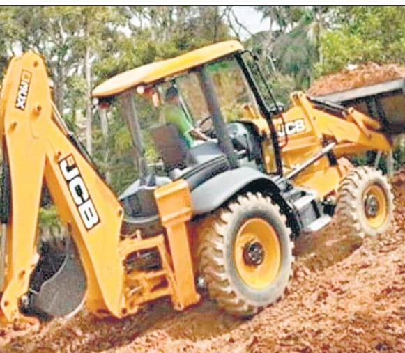
बांध बहाव क्षेत्र के 16 अतिक्रमणों को तोड़ने के नोटिस चर्या करने के बाद आगे की कार्रवाई शुरू ।

टीम ने सभी 16 अतिक्रमणकारियों को नोटिस दिए। मौके पर खाली पड़े प्लॉट की चारदीवारी पर नोटिस चर्या भी किए गए। विभाग ने लिखा है कि अतिक्रमण को आप स्वयं के खर्च पर 07 दिवस