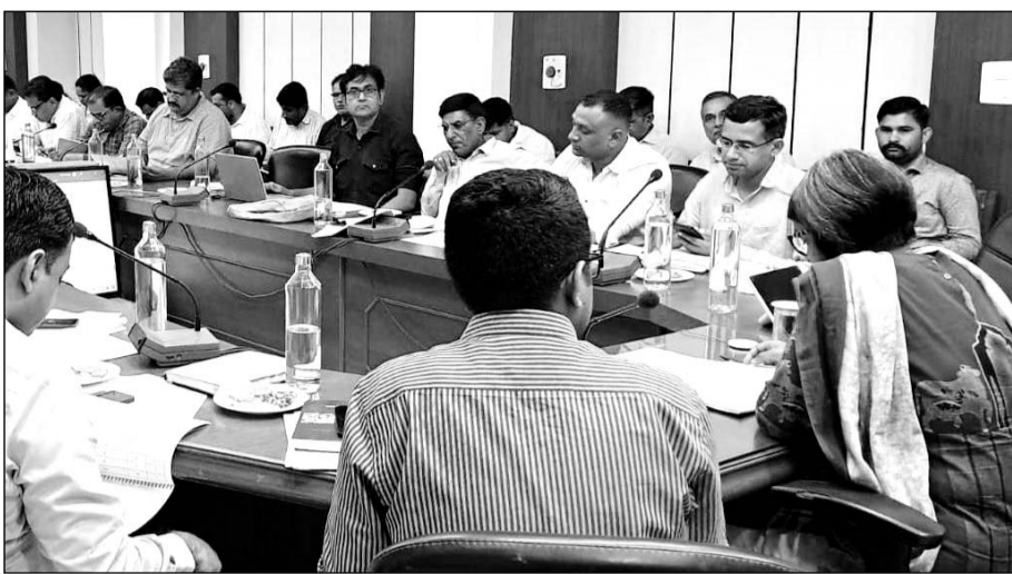
बीकानेर कलेक्टर ने ग्रामीण विकास एवं पंचायत राज विभाग की योजनाओं की समीक्षा बैठक को संबोधित किया।

उन्होंने मरनेगा के तहत व्यक्तिगत लाभ के अधिक से अधिक कार्य करवाने के निर्देश दिए। एमएलए और एमपी लेंड के स्वीकृत, प्रगतिरत और पूर्ण कार्यों के बारे में जाना तथा पूर्ण कार्यों के पूर्णता प्रमाण पत्र उपलब्ध