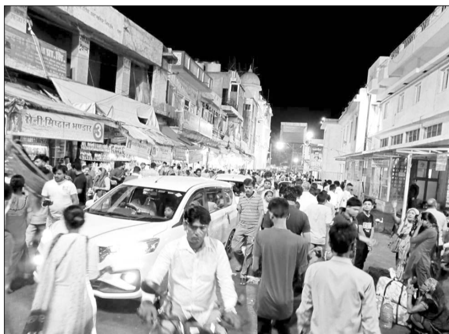
बालाजी मन्दिर को जाने वाले रास्ते में एवं बाजार में, दुकानदारों ने एवं टेलीवालों ने अतिक्रमण कर रखा है।

परिवाद में यह भी अंकित किया गया है कि मंदिर के रास्ते में पुलिस द्वारा तीन जगह हॉर्डिंग, बैरिकेट्स लगा रखे हैं परंतु पुलिस को पैसे देने पर गाड़ियों को बिना पार्क किये ही मंदिर तक जाने दिया जाता है। पार्किंग के नाम पर पुलिस ने भारी लूट मचा रखी है। पैसे नहीं देने