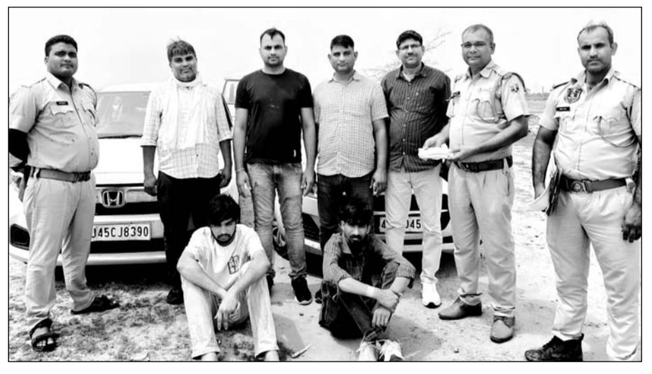
रामनगरिया पुलिस ने फिरौती के लिए 3 युवकों का अपहरण करने वाले दो बदमाशों को गिरफ्तार किया।

जयपुर । रामनगरिया थाना पुलिस ने फिरौती के लिए तीन युवकों का अपहरण करने वाले दो बदमाशों को गिरफ्तार कर तीनों अपहृत युवकों को छुड़वा लिया। आरोपियों ने फिरौती के लिए अपहरण किया था और उनके दोस्त से 5-5 लाख रुपयों की मांग की थी। पुलिस ने उनके कब्जे से पिस्तौल बरामद की है।