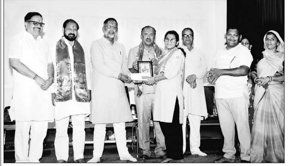
विधानसभाध्यक्ष वासुदेव देवनानी रिवार को कोटा में विद्या भारती शिक्षा संस्थान के प्रतिभा सम्मान समारोह को मुख्य अतिथि के रूप में संबोधित किया।

जयपुर। विधानसभा अध्यक्ष वासुदेव देवनानी ने कहा कि समाज में परिवर्तन लाने के लिए नई पीढ़ी को संस्कारवान बनाना हम सभी की जिम्मेदारी है। नई पीढ़ी को राष्ट्रीयता, देश प्रेम एवं मूल्यों की शिक्षा देकर उनमें देश के लिए समर्पण का भाव उत्पन्न कर हम 2047 तक विकसित भारत का संकल्प पूरा कर सकेंगे। देवनानी रिवार को कोटा में विद्या भारती शिक्षा संस्थान के प्रतिभा सम्मान समारोह को मुख्य अतिथि के रूप में संबोधित कर रहे थे।