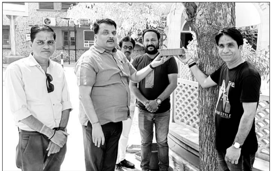
पाली कलेक्टर लक्ष्मीनारायण मंत्री ने जन्मदिन पर कलेक्टर परिसर में परिंडे लगाए।

पाली, (नि.सं.)। जिला कलेक्टर लक्ष्मीनारायण मंत्री ने गुरुवार को अपना जन्म दिन सादगीपूर्वक मूक पक्षियों के लिए कलेक्टर परिसर में परिंडे लगाकर सेवा के पुनित कार्य में सहयोग किया। जिला कलेक्टर ने बताया कि पाली शहर में पड़ रही भीषण गर्मी के चलते मूक पशु-पक्षियों के लिए पानी की