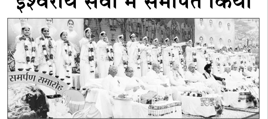
23 युवा बाल ब्रह्मचारिणी बहनों ने अपना जीवन ईश्वरीय सेवा में समर्पित करने की शपथ ली।

जयपुर। जयपुर की सड़कों पर उस समय अध्यात्म की अन्तुटी धारा बह निकली जब 16 बगियाँ पर सवार 23 युवा बाल ब्रह्मचारिणी बहनों का कार्यक्रम का तादाद में लोगों ने जगह जगह फूल बरसाकर उनका भव्य स्वागत किया। इस मनोरम दृश्य को देखने के लिए सड़कों पर लोग ठहर गये। सबसे पहले बगियाँ में संस्थान की अतिरिक्त मुख्य प्रशासिका तथा यूरोपियन सेवाकेन्द्रों की निदेशिका राजयोगिनी