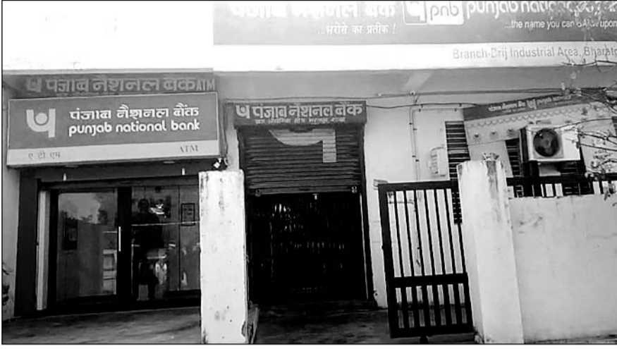
उद्योग नगर थाना क्षेत्र का पीएनबी बैंक जहां बदमाशों ने की लूट की घटना को अंजाम दिया।

दोपहर 2.30 बजे के आसपास बाइक सवार तीन बदमाश पीएनबी बैंक के पास आये जहां दो बदमाशों ने अंदर प्रवेश किया और एक बाहर खड़ा रहा। पांच से सात मिनट दोनों बदमाश पचीं के बहाने अंदर बैठे रहे। जिसमें एक बदमाश ने मफलर और दूसरे ने हेलमेट पहन रखा था। इनमें से एक बदमाश कैशियर के पास गया और हवाई फायरिंग की जो बैंक की छत में लगा। अंदर जो व्यक्ति थे उन्हें हथियार के बल पर एक कोने में खड़ा कर दिया जिसके बाद बदमाश 23 हजार पांच सौ रुपए की लूट करके भाग गया। घटना