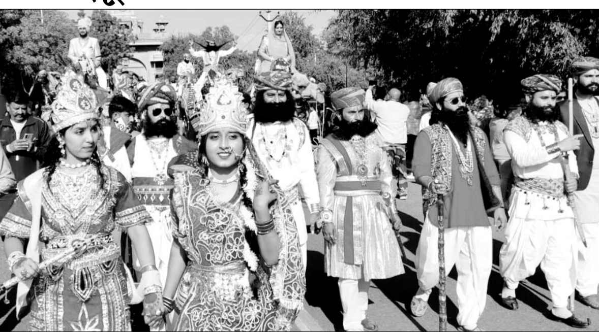
कार्निवल में राधा-कृष्ण के रूप में सजे बच्चों एवं विंटेज कारों में बैठे देशी-विदेशी पर्यटक स्थानीय लोक धुन पर थिरकते नजर आए।