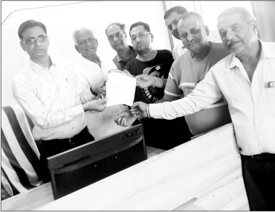
व्यापारियों ने मुख्य निर्वाचन अधिकारी के नाम उपखंड अधिकारी को ज्ञापन दिया।