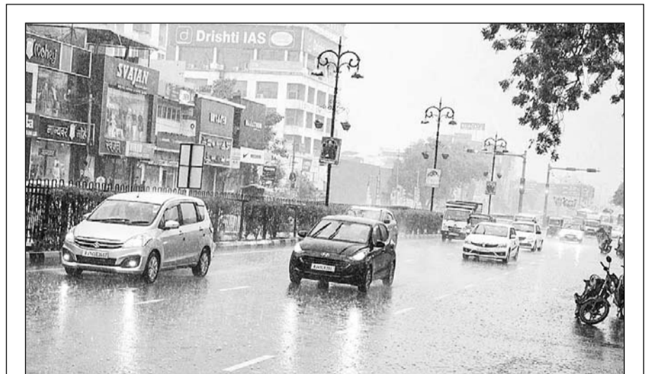
जयपुर में दोपहर बाद काली घटाएं घिर आईं और तेज बर्षा होने लगी। इस दौरान सड़कों पर पानी भर गया और वाहन चालकों को भारी परेशानी का सामना करना पड़ा। वहीं भारी टंड की वजह से लोग घरों में दुबकने को मजबूर हो गये।

कोंग्रेस सेवा दल भी अपने पुराने स्वरूप को निखारकर संगठन को और मजबूत बनाते हुए आरएसएस को टक्कर देने की तैयारी में है।