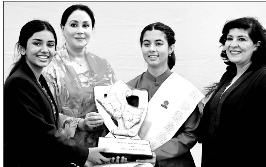
डिप्टी सीएम दीया कुमारी ने छात्राओं को ट्रॉफी प्रदान की।

मेयो कॉलेज में रविवार को आयोजित वार्षिक पारितोषिक वितरण समारोह में डिप्टी सीएम दीया कुमारी ने शिरकत की। इस अवसर पर उन्होंने कहा कि बालिकाएं देश के भविष्य को आकार देने वाली बनेगी। उन्होंने कहा कि छात्राएं भारत के भविष्य में समाज की पथ प्रदर्शक बनेगी। इनके द्वारा अपनी मेधा एवं नैतिकता के बल पर देश के भविष्य को आकार देने में महत्वपूर्ण भूमिका निभाई जाएगी। इनके द्वारा प्रदेश और देश का नाम रोशन किया जाएगा। दीया कुमारी ने कहा कि बेटियों ने देश का नाम रोशन किया है। मेयो कॉलेज गर्ल्स स्कूल को बेस्ट रेजिडेंशियल स्कूल का खिताब मिला है, इसके लिए सभी बधाई दी। समारोह में पेरिस ओलम्पियन 2024 दोहा (करर) में आयोजित शांटगन ओलंपिक क्वालीफिकेशन चैम्पियनशिप में रजत पदक विजेता, इंडियन स्कोट