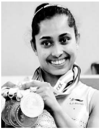
मेरे जीवन का केंद्र रहा और मैं उतार-चढ़ाव

नई दिल्ली, 7 अक्टूबर। भारत की स्टार जिम्नारिस्ट दीपा कर्माकर ने अचानक संन्यास लेकर सबको चौंका दिया है। दीपा 2016 के रियो ओलंपिक में पदक से चूक गई थीं, उन्होंने पांचवां स्थान हासिल किया था। 31 वर्षीय दीपा ओलंपिक में हिस्सा लेने वाली भारत की पहली महिला जिम्नारिस्ट बनीं थीं। उनका रियो ओलंपिक के वॉल्ट इवेंट में महज 0.15 पॉइंट से ओलंपिक में मेडल जीतने का सपना अधूरा रह गया था।