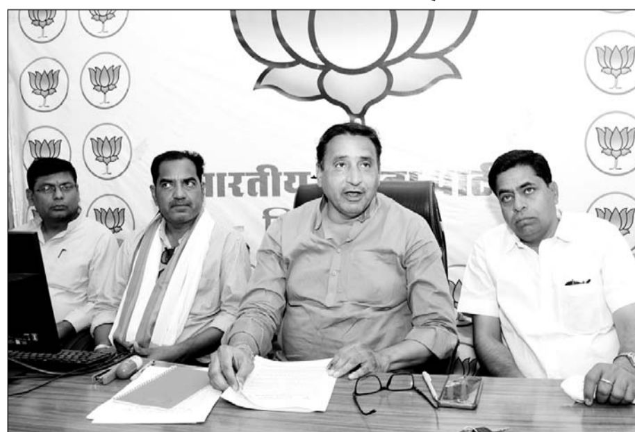
मोदी सरकार के दस वर्षों के कार्यकाल को लेकर बुधवार को जिला कार्यालय में प्रेस कॉन्फ्रेंस की।

पुरी दुनिया ने देश के चिकित्सकों का लोहा माना। कोरोना काल में 81 करोड़ गरीबों को निःशुल्क अन्न देकर लोगों के जीवन की सुरक्षा की, उज्ज्वला योजना के 10 करोड़ माताओं-बहनों को धुंरे से मुक्ति मिलाती 14 करोड़ परिवारों को नल से जल दिया गया। आयुष्मान भारत योजना के तहत 5 लाख तक का बीमा कवरेज दिया गया। वहीं राजस्थान की