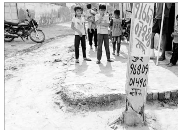
गांव भाकरा में हादसे को न्यौता देता जर्जर विद्युत पोल।