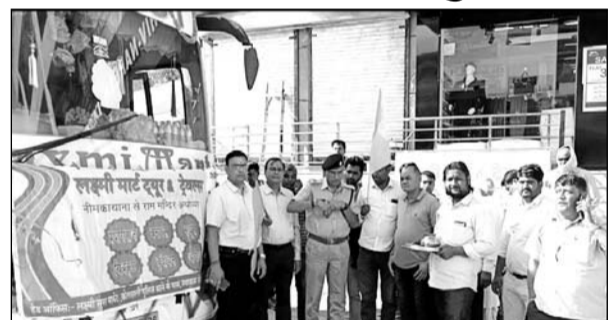
अयोध्या के लिए पांच दिवसीय तीसरा भ्रमण दल रवाना।