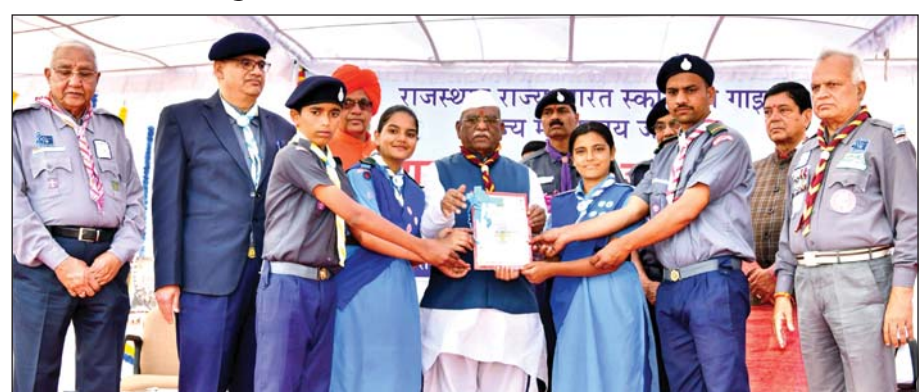
राज्यपाल हरिभाऊ बागडे ने स्काउट-गाइड के उत्कृष्ट प्रदर्शन वाली जिला इकाइयों को राज्य स्तरीय पुरस्कार प्रदान किए।

जयपुर। राज्यपाल हरिभाऊ बागडे ने कहा कि स्काउट गाइड संगठन नहीं, आदर्श कार्य संस्कृति है। उन्होंने कहा कि इस संगठन के जरिए प्रयास किया जाए कि नवयुवकों की बौद्धिक क्षमता बढ़े। इसी से भारत सभी क्षेत्रों में तेजी से विकास की ओर अग्रसर हो सकेगा। राज्यपाल शनिवार को राजस्थान राज्य भारत स्काउट गाइड राज्य