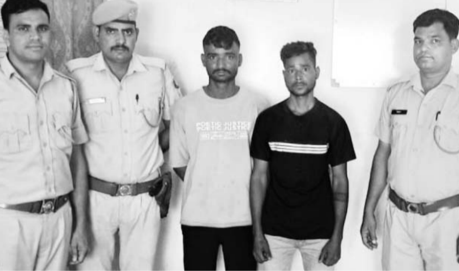
देवली निकटवर्ती हनुमान नगर थाना पुलिस ने मोबाइल छीनने के दो आरोपियों को गिरफ्तार किया।