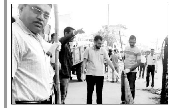
स्वच्छता ही सेवा अभियान के तहत सफाई करते अधिकारी।