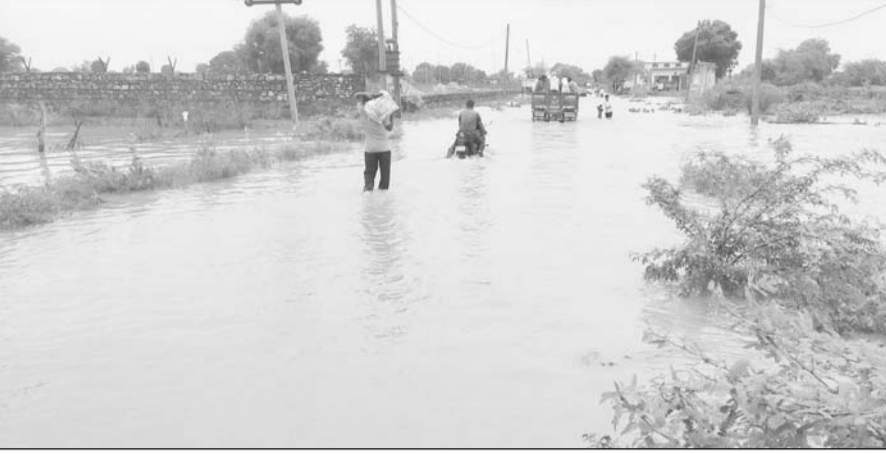
हिण्डौन सिटी शहर सहित आसपास के क्षेत्र में बारिश से कई इलाके जलमग्न हो गए।