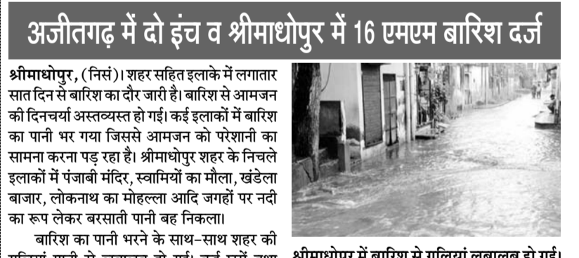
अजीतगढ़ में दो इंच व श्रीमाधोपुर में 16 एमएम बारिश दर्ज