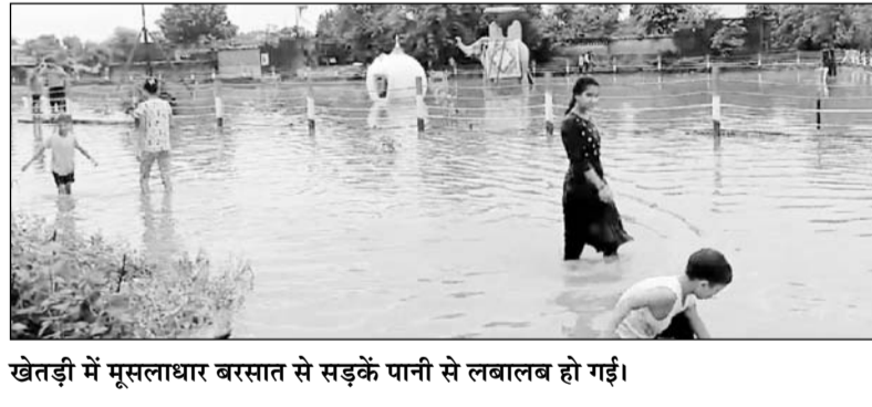
खेतड़ी में मूसलाधार बरसात से सड़कें पानी से लबालब हो गईं।