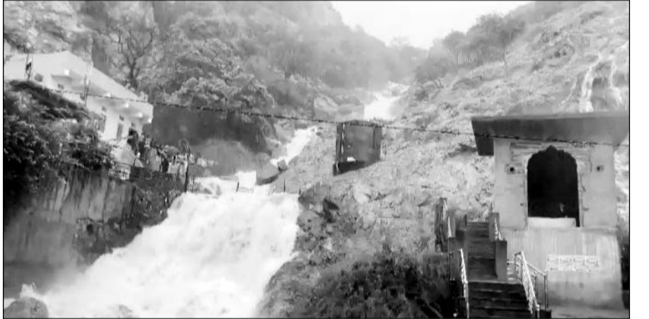
बरसात से सामोद के पास महार कलां स्थित मालेश्वर धाम की पहाड़ियों से नदी बहती नजर आई।

मोरिया, हाथनोदा, चौथवाड़ी, बासां, महार, कानपुरा सहित आसपास के कई गांवों में तेज बरसात होने के समाचार मिले हैं। बरसात होने से गांवों के खेतों में पानी भर गया। बरसात से सामोद के पास स्थित मालेश्वर धाम पर जोरदार नदी आई और झरने चल गये। नदी को देखने के लिये आसपास