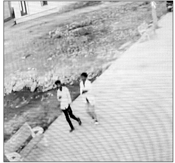
सीसीटीवी फुटेज में चोरी की वारदात के संदिग्ध कैद हो गये।

■ पारिवारिक कार्यक्रम में बाहर गया हुआ था परिवार, वापस लौटने पर घर का ताला टूटा मिला