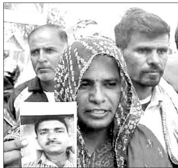
कलेक्ट्रेट पर प्रदर्शन के दौरान गुमशुदा की फोटो दिखाते हुए परिजन।

प्रशासन से न्याय की गुहार लगाने मंगलवार सुबह एसपी ऑफिस पहुंचे। परिवार के साथ आए ग्रामीणों ने कलेक्ट्रेट पर प्रदर्शन किया और पुलिस पर गंभीर आरोप लगाते हुए मांग की कि लापता युवक का पता लगाया जाए। परिवार के सदस्यों का रो-रोकर बुरा हाल है। कलेक्ट्रेट पर प्रदर्शन के दौरान युवक की मां बेहोश हो गई। परिजन व ग्रामीणों ने कहा कि युवक का खोजबीन की जाए। जिला प्रशासन के समक्ष न्याय की