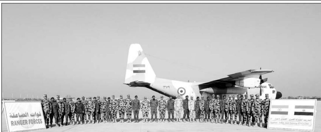
महाजन फील्ड फायरिंग रेंज में भारत और मिस्र के बीच संयुक्त युद्धाभ्यास "साइक्लोन-2025" शुरू हुआ।

■ "साइक्लोन-2025" का प्राथमिक उद्देश्य भारत और मिस्र के बीच रक्षा सहयोग को मजबूत करना है