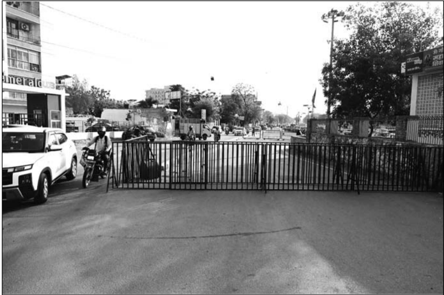
मालवीय नगर क्षेत्र में रविवार को पुलिस और आरएसी कंपनियों के जवानों ने फ्लैग मार्च निकाला। इसके साथ ही नंदपुरी क्षेत्र में बैरिकेड्स लगाकर रास्ते बंद कर दिए हैं।

इंटरनेट-मैसेज और सोशल मीडिया एप्स बंद रहेंगे, बिना अनुमति रैली-जुलूस निकालने पर भी पाबंदी