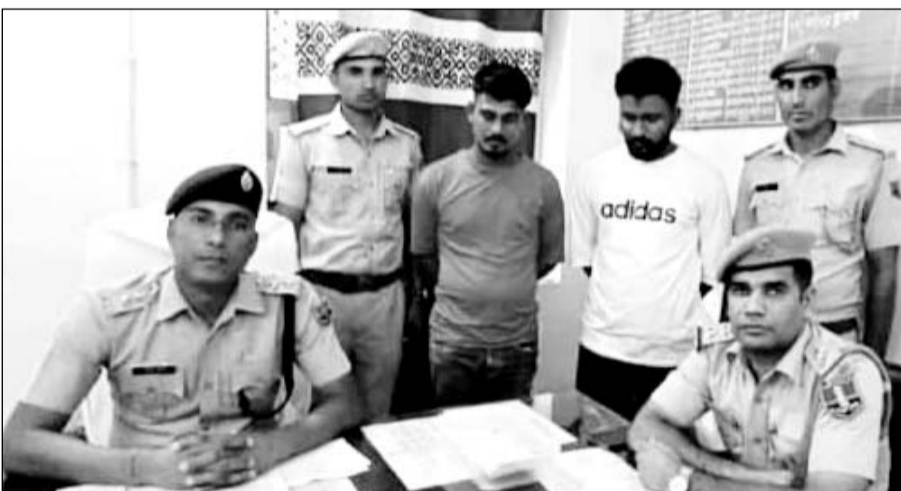
लाम्बाहरिसिंह कस्बे में जाली नोट बाजार में चलाने दो युवकों को पुलिस ने दबोचा।