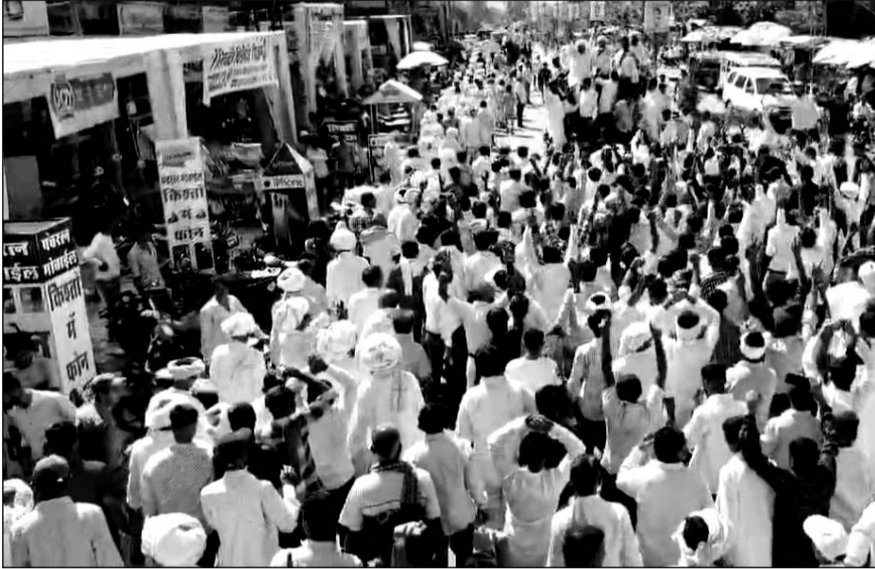
मांगों को लेकर पटेल, पाटीदार, डांगी समाज ने रैली निकाली।

डूंगरपुर, (निस)। टीएसपी क्षेत्र में ओबीसी आरक्षण को लेकर पटेल, पाटीदार, डांगी समाज मुखर हुआ। जिला मुख्यालय पर पटेल पाटीदार डांगी समाज ने गुरुवार को सरदार पटेल जयंती के उपलक्ष्य में शक्ति प्रदर्शन करते हुए विशाल महारैली निकाली। श्री राष्ट्रीय सरदार पटेल सेना के नेतृत्व में सुबह दस बजे पाटीदार छात्रावास में समग्र पटेल, पाटीदार, डांगी समाजजन एकजुट हुए। सैकड़ों की तादाद में चौपहिया, ट्रैक्टर वाहनों को लेकर महारैली में भाग लेने के लिए समाजजन आए। महारैली पाटीदार छात्रावास से रवाना हुई। 50 हजार से ज्यादा की संख्या में सफेद वेशभूषा में युवा व बुजुर्ग शामिल हुए। महारैली पाटीदार छात्रावास से नए बस स्टैंड, पुराने बस स्टैंड व तहसील चौराहा होते हुए कलेक्ट्रेट से सरदार पटेल चौराहे पर पहुंचे। वहां सरदार पटेल की प्रतिमा पर माल्यार्पण कर दशहरा मैदान में सभा का आयोजन किया गया।