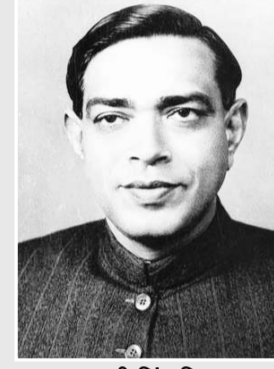
रामधारी सिंह दिनकर