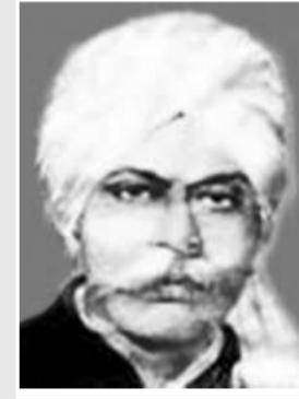
आचार्य किशोरी दास वाजपेयी