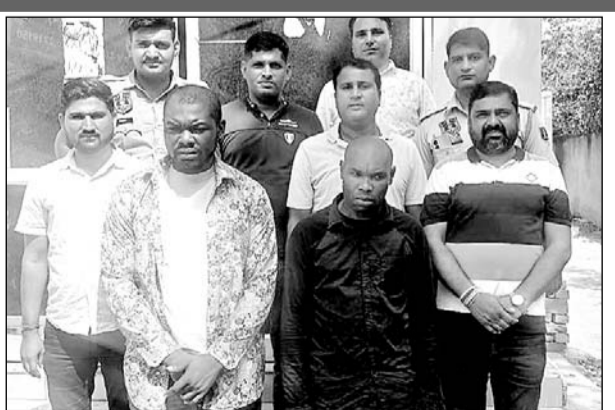
जयपुर के प्रताप नगर इलाके में पुलिस ने दो विदेशी युवकों को मादक पदार्थों की तस्करी करते गिरफ्तार किया।

प्रताप नगर इलाके की श्रीराम कॉलोनी में पुलिस ने एक अपार्टमेंट में दबिश मारकर दोनों विदेशी युवकों को तस्करी करते हुए पकड़ा