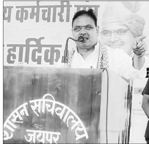
मुख्यमंत्री भजनलाल शर्मा ने गुरुवार को शासन सचिवालय में राजस्थान सचिवालय कर्मचारी संघ के शपथ ग्रहण समारोह को संबोधित किया।

शर्मा ने कहा कि सचिवालय में आधारभूत ढांचों के विकास कार्यों से अधिकारी व कर्मचारी स्वच्छ एवं सुगम कार्यस्थल पर काम कर पाएंगे। इसी क्रम में यहां बहुमंजिला मुख्य सचिव ब्लॉक, नॉर्थ ब्लॉक और साउथ ब्लॉक के निर्माण के लिए 275 करोड़ रुपये की स्वीकृतियां जारी कर दी गई हैं। 70 करोड़ की लागत से नॉर्थ ब्लॉक का निर्माण कार्य प्रगतिरत है। सचिवालय