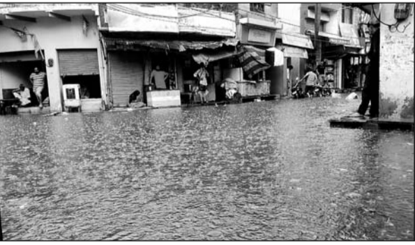
किशनगढ़ बास के मानसून की पहली बरसात में ही मुख्य बाजार में पानी भर गया।

किशनगढ़ बास, (निर्स)। किशनगढ़ बास में बुधवार दोपहर को हुई मानसून की पहली करीब 50 मिमट की बारिश से एक तरफ जहां लोगों को गर्मी से राहत मिली है वहीं दूसरी ओर मुख्य बाजार व गंज रोड की सड़कें पानी से जलमग्न हो गईं। दुकानों के अंदर पानी प्रवेश करने से व्यापारियों का भारी नुकसान हुआ है। शहर में पानी की निकासी की अवरुद्ध समस्या का समाधान नहीं हो पाने के कारण व्यापारियों में भारी आक्रोश नजर आया।