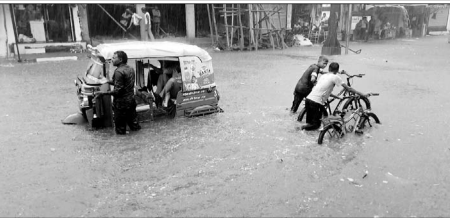
धौलपुर में बरसात होने से सड़कों पर पानी भरने से वाहन चालक परेशान हुये।

धौलपुर, (निर्स)। पिछले कई दिनों के इंतजार के बाद आखिरकार बुधवार शाम को लगभग पूरे धौलपुर जिले में एक घंटे जमकर बरसात हुई। धौलपुर शहर में 65 एमएम (डेढ़ इंच) बारिश दर्ज की गई। वहीं तेज बरसात के कारण धौलपुर शहर के मुख्य मार्गों एवं कॉलोनीयों में भारी जल भराव हो गया, जिससे लोगों को भारी परेशानी को सामना करना पड़ा। बरसात से लोगों को गर्मी से राहत मिली।